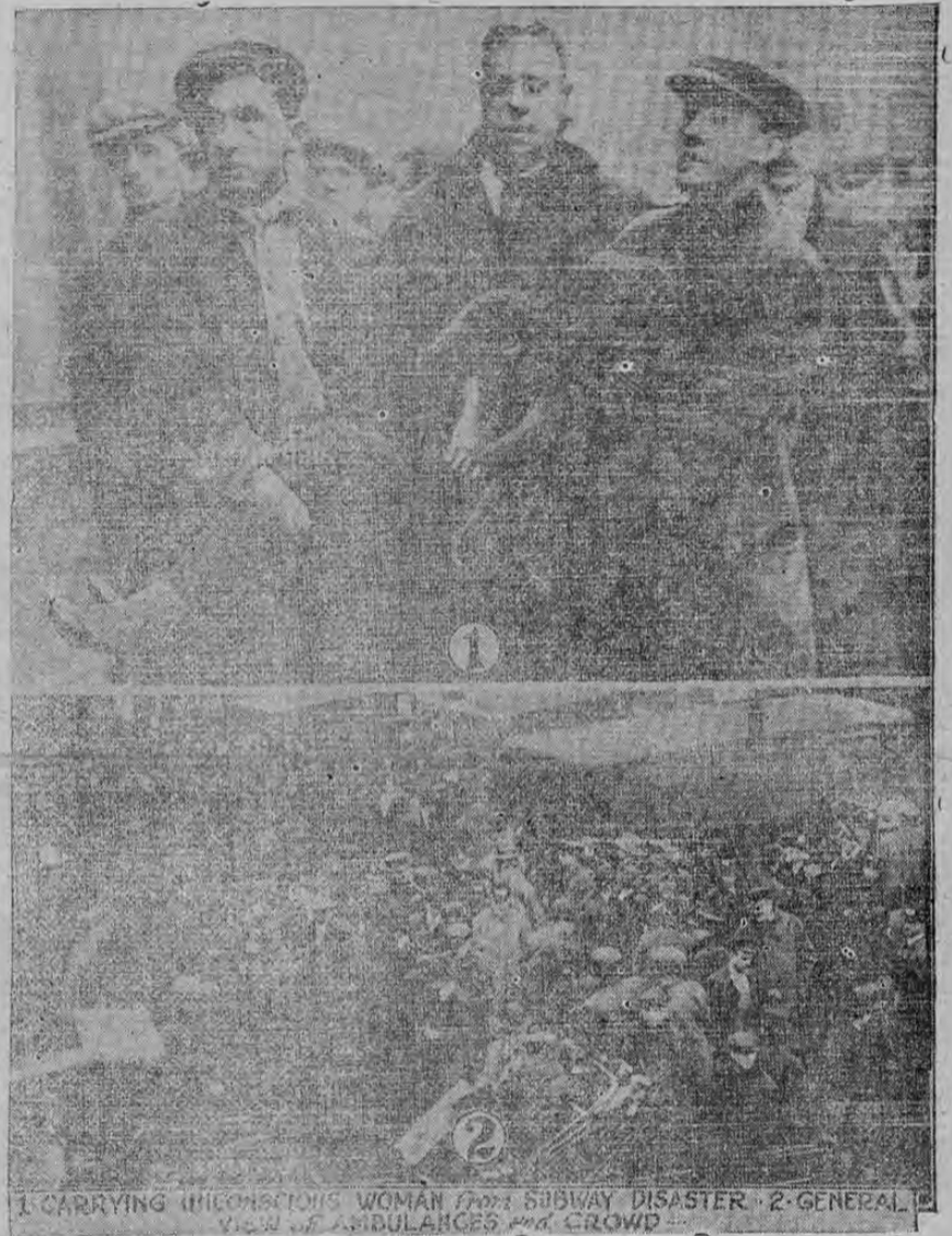
1-CARRYING UNCONSCIOUS WOMAN FROM SUBWAY DISASTER. 2-GENERAL VIEW OF AMBULANCES AND CROWD.

El grabado superior muestra a varios individuos que en brazos conducen a una mujer que perdió el sentido en el primer desastre subterráneo que ha ocurrido en Nueva York. En el grabado inferior aparece una parte de la multitud y de las ambulancias que se reunieron en torno del teatro del desastre, en la confluencia de las calles 55 y Broadway. La desgracia fue ocasionada al quemarse el fuso principal, lo que dió por resultado la suspensión inmediata de todo tráfico en el sistema subterráneo, precisamente en las horas de más movimiento, que son las de la mañana. Más de 200 personas fueron trasladadas a los hospitales. Una mujer murió instantáneamente.